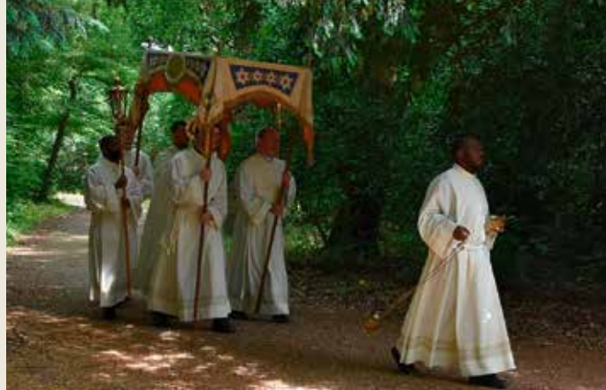
Sacramentsprocessie in het bedevaartpark