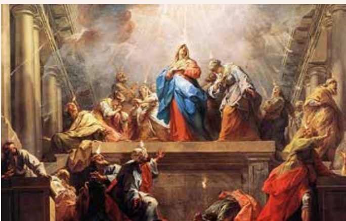
Pinksteren, Jean Restout II, 1732, Louvre, Parijs

met Tweede Pinksterdag in het Julianaklooster op het Heiligdom van Heiloo. Dagelijks zal ik twee inleidingen rond dit thema verzorgen. Daarnaast zijn er Eucharistievieringen en gebedsmomenten. Er zal voldoende tijd zijn voor stilte en persoonlijke bezinning. In de tijd na het eerste Pinksterfeest leven we in het tijdperk van de Heilige Geest. Jezus is niet meer lichamelijk onder ons. Hij is nu bij ons door zijn Heilige Geest. Door die Geest leidt en bestuurt Hij zijn Kerk. Hij bewaart haar in de waarheid, in de eenheid en de liefde en Hij voedt en sterkt haar door de sacramenten, zichtbare tekenen die door Hem sacramenten van heil worden. Hoe belangrijk de Heilige Geest ook is voor ons leven als christen, toch blijft hij voor veel mensen de grote onbekende. Van de hemelse Vader hebben wij een voorstelling, de figuur van Jezus is ons heel vertrouwd, maar de Heilige Geest blijft vaak een moeilijke figuur. Tegelijk zien we ook in het christendom van vandaag dat bepaalde groepen met Hem op een soms dweperige manier aan de haal gaan en Hem zich toe-eigenen. Ze zien Hem vaak geheel of gedeeltelijk los van de Kerk en de kerkelijke traditie en beroepen zich sterk op gevoel en beleving. Hoe ziet de katholieke traditie de Heilige Geest? Wie is Hij echt? Hoe is Hij onze Helper? Hierover willen we in onze Pinksterretraite nadenken. U bent van harte welkom.