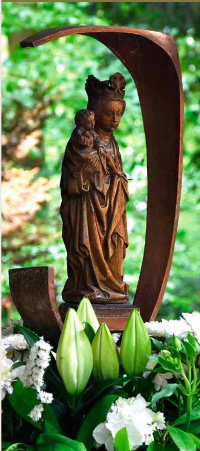
Het houten beeldje van OLV ter Nood