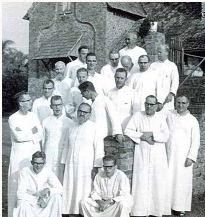
Kruisheren in Congo die later werden gegijzeld en de marteldood stierven

heid hand in hand gingen. Laten ook wij nu gehoor geven aan de encycliek Rerum Ecclesiae ! Tegenwoordig zenden we bijna geen missionarissen meer uit, maar ontvangen wij ze. Laten we ons samen inzetten voor de Kerk in Nederland door ons goed te vormen in het geloof en door het ontvangen van de sacramenten, een heilig leven te leiden en daarvan te getuigen. Wanneer de Kerk hier weer stevig gegrondvest mag zijn, als volwassen Kerk, kan ze genoeg eigen Nederlandse geestelijken voortbrengen en kunnen we zelfs weer missionarissen uitzenden naar waar het nodig is. Ook ons Heiligdom heeft meerdere congregaties gekend. Nu zijn we gezegend met het Grootseminarie St. Willibrord waar de priesters van de toekomst opgeleid worden. Wij zusters vinden het ook geweldig om hier missiewerk te mogen doen, op een plek waar we zoveel mensen ontmoeten die door Maria hier tot Jezus komen. De laatste tijd zijn er ook meerdere mensen die, zoekende naar een diepere relatie met God, graag gedoopt willen worden. Ik vraag uw gebed en inzet voor de missie in ons eigen land, de heiligheid van de priesters en religieuzen, en de volharding van elk van hen, opdat de Kerk weer mag opbloeien en zoals eertijds veel mooie vruchten mag dragen. Laten we dit vragen op voorpraak van onze lieve Moeder, Onze Lieve Vrouw ter Nood, en hier ook zelf een bijdrage aan leveren.