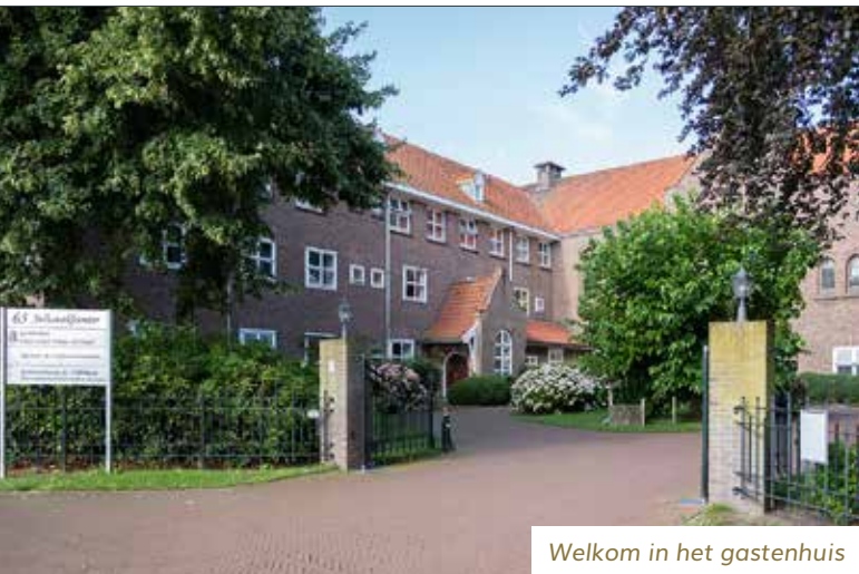
Welkom in het gastenhuis

Rechtsonder: Deelnemers aan de jaarlijkse wandeltocht 'De 4 van Alkmaar' bezoeken de Genadekapel om een kaars bij Maria aan te steken