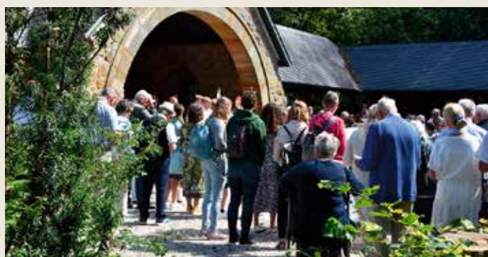
Vele pelgrims verzamelen zich bij de Genadekapel