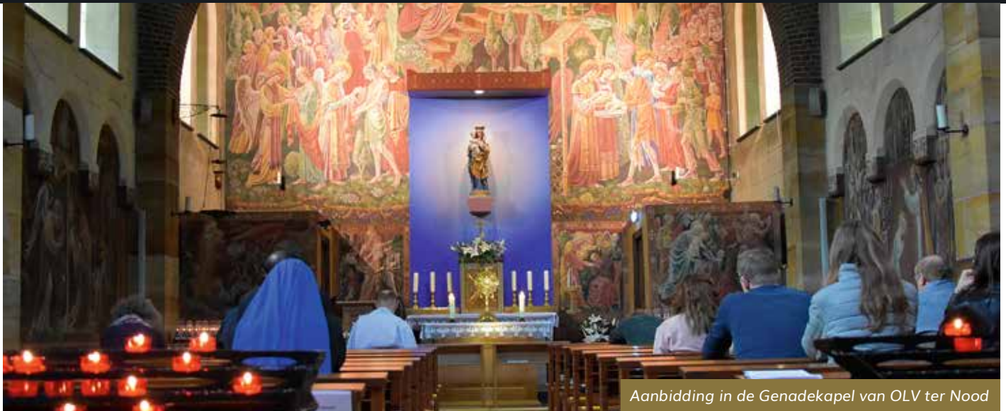
Aanbidding in de Genadekapel van OLV ter Nood

Hoe heerlijk is het om je in de warmte van de zon te laten koesteren en dankzij de zonnestrallen meer diepte en kleur in de natuur te zien. Alles ziet er dan zo anders uit dan op een grauwe en grijze dag.