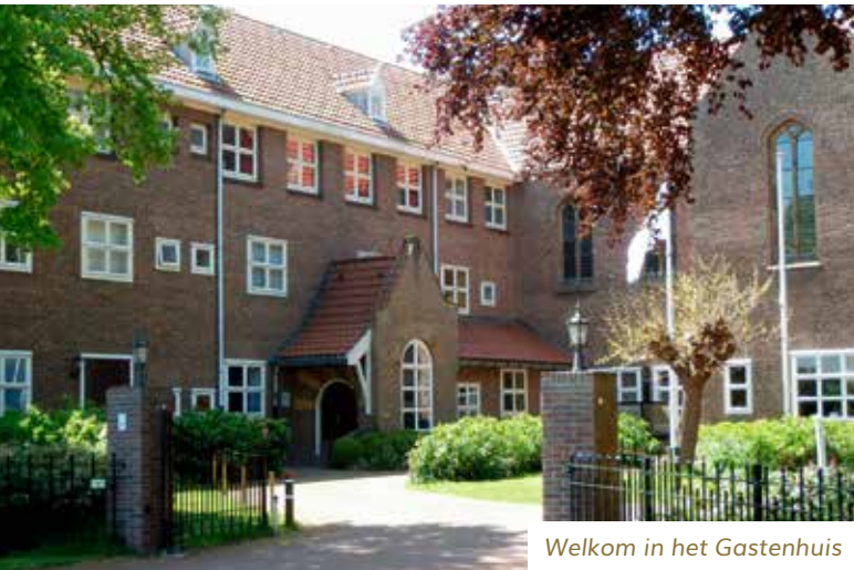
Welkom in het Gastenhuis

Rechtsonder: De heer Gert Visser, vrijwilliger bij Onze Lieve Vrouw ter Nood