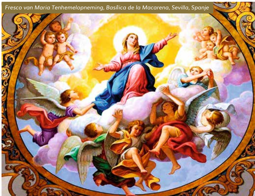
Fresco van Maria Tenhemelopneming, Basilica de la Macarena, Sevilla, Spanje

Onze hemelse moeder wenst dat wij allen de hemel al hier op aarde in ons hart dragen. In haar hart was altijd het paradijs, waar Satan en het kwaad nooit toegang hadden. Als wij ons aan Maria toewijden, haar bewust erkennen en aanvaarden als onze moeder, kan zij ons begeleiden en beschermen op onze weg naar de hemel. Ze reikt ons de rozenkrans aan als een ladder om ons en onze dierbare overledenen toegang te geven tot de hemel, tot de gemeenschap van de heiligen. In de overweging van de rozenkransgeheimen leidt ze ons dieper in de mysteries van het Rijk der Hemelen. Door haar, met haar en in haar zal Jezus in ons zijn gestalte aannemen en als Koning in onze harten heersen. En de heerschappij van Gods Liefde en de heerschappij van Maria als Koningin van de Hemel in de harten van alle mensen zal vrede, de hemel op aarde, brengen.