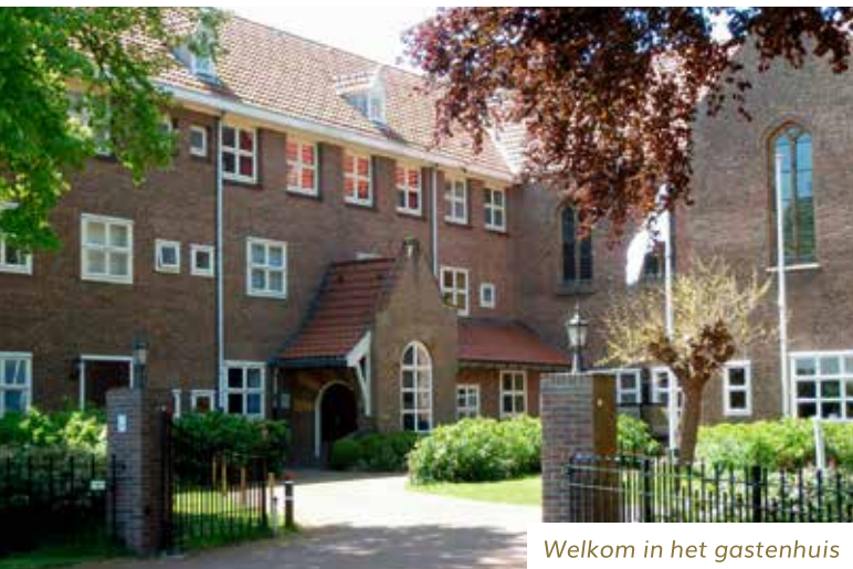
Welkom in het gastenhuis

Rechtsonder: Mevrouw Inge Rijkers-Pluijlaar op bezoek bij haar oma, mevrouw Corrie Bakker-Sprekeling