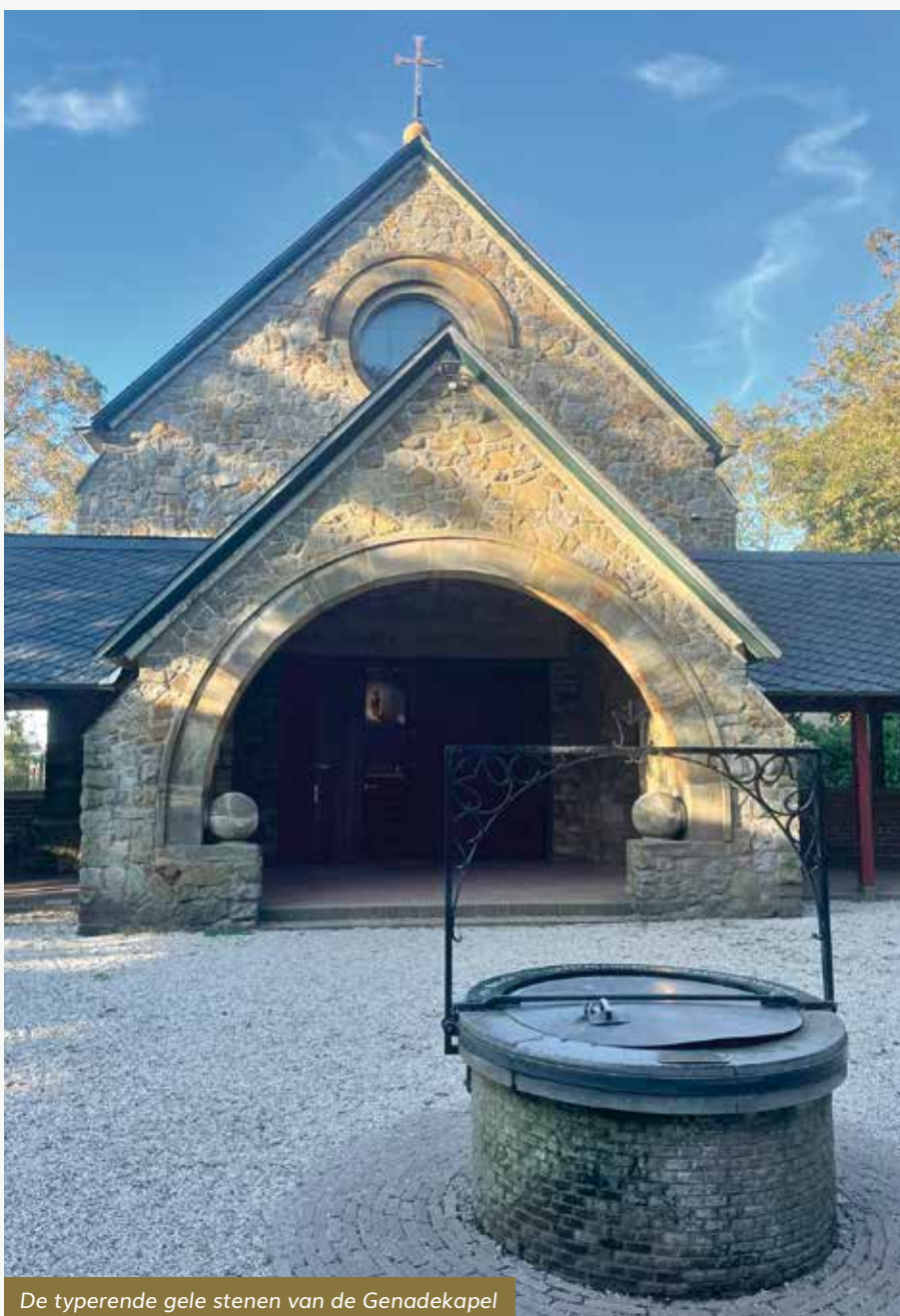
De typerende gele stenen van de Genadekapel