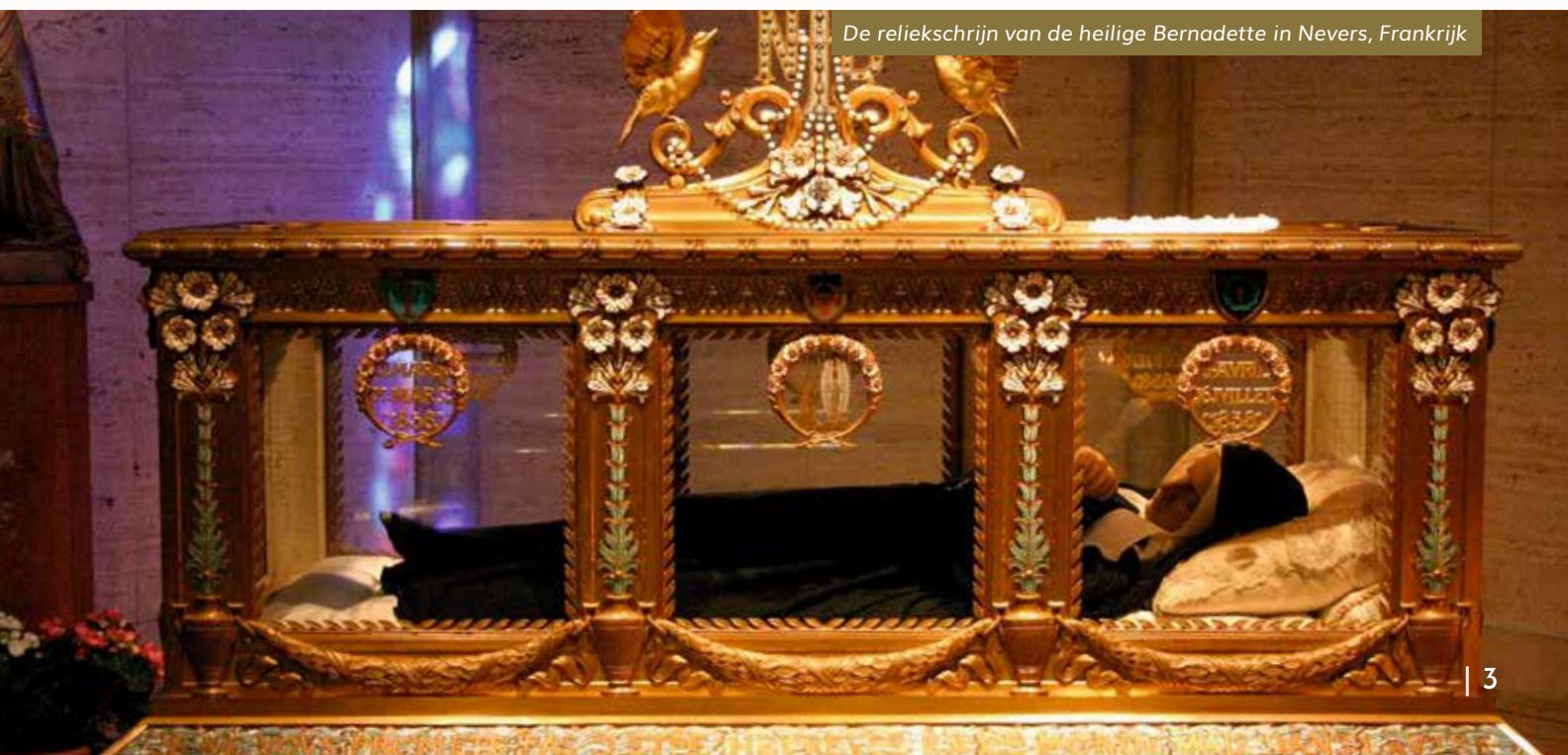
De reliekschrijn van de heilige Bernadette in Nevers, Frankrijk