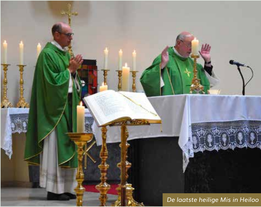
De laatste heilige Mis in Heiloo