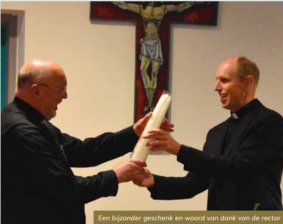
Een bijzonder geschenk en woord van dank van de rector

"Ik heb jaren achter de tralies doorgebracht..."