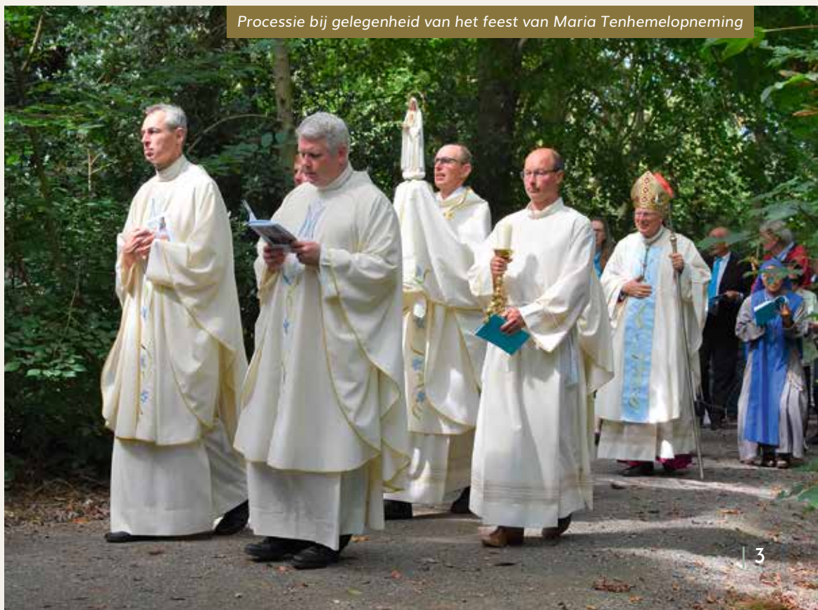
Processie bij gelegenheid van het feest van Maria Tenhemelopneming

In het najaar begint alles weer te lopen op ons Heiligdom: de gezins- en jongerenactiviteiten van de zusters, bezinningsdagen en retraites, de Loven en Prijzen Heiloo avonden, de Alpha cursus en er is een nieuwe cursus met een inleiding op het spirituele leven. Wij hopen dat we zo voor een ieder ingangen mogen bieden om zijn of haar geloof te verdiepen. Kijkt u voor de complete informatie achter in dit Vriendenmagazine of ga naar onze website. We hopen u graag te ontmoeten bij één van deze activiteiten, of natuurlijk "gewoon" bij de heilige Mis op zondag of doordeweeks, als u een kaarsje bij ons komt aansteken, of in het Oesdom. Tot gauw!