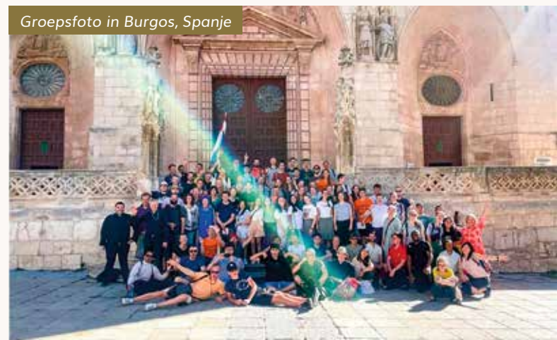
Groepsfoto in Burgos, Spanje

Terug op weg naar Nederland maakten we nog een laatste stop in Lourdes. Het was heel bijzonder om samen de rozenkrans te bidden bij de grot van Bernadette. Als afsluiting baden we het Wees Gegroet in allemaal verschillende talen tijdens een lichtjesprocessie, waarbij iedereen Gods aanwezigheid sterker voelde dan ooit. Het was een geschenk van God om mee te mogen op deze reis, zoveel inspirerende mensen te leren kennen en om te kunnen delen in ons geloof. Iedereen heeft de kans gekregen om hun band met God te versterken door vanuit de hele wereld samen te komen in de prachtige stad Lissabon.