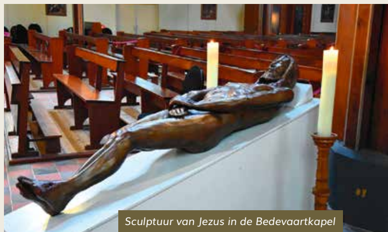
Sculptuur van Jezus in de Bedevaartkapel

De tentoonstelling over de lijkwade is van maandag 20 maart tot en met zondag 2 april te bezoeken in de Bedevaartkapel van OLV ter Nood. Zie voor meer informatie de agenda op pagina 10-11.