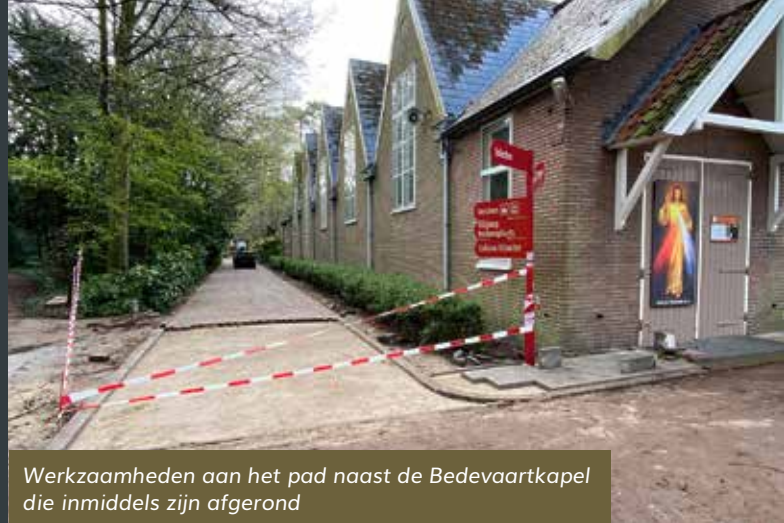
Werkzaamheden aan het pad naast de Bedevaartkapel die inmiddels zijn afgerond

Zoals ik al in eerdere berichten heb mogen vertellen zijn er heel wat werkzaamheden en activiteiten binnen ons mooie Heiligdom die op dit moment gaande zijn of binnenkort worden opgestart. Graag breng ik u op de hoogte van de laatste stand van zaken.