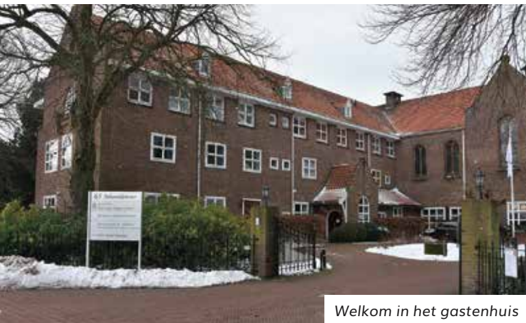
Welkom in het gastenhuis

Rechtsonder: Reconstructie van het gezicht op de Lijkwade van Turijn