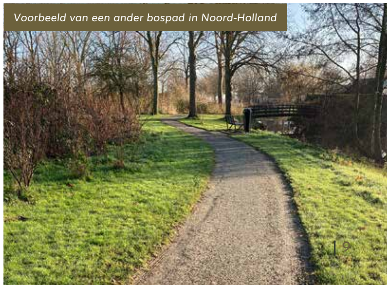
Voorbeeld van een ander bospad in Noord-Holland

Uiteraard zullen wij u via allerlei kanalen zo veel mogelijk op de hoogte houden van alles wat er te gebeuren staat en in ontwikkeling is. Als bestuur zijn wij u zeer dankbaar voor uw betrokkenheid en financiële ondersteuning.