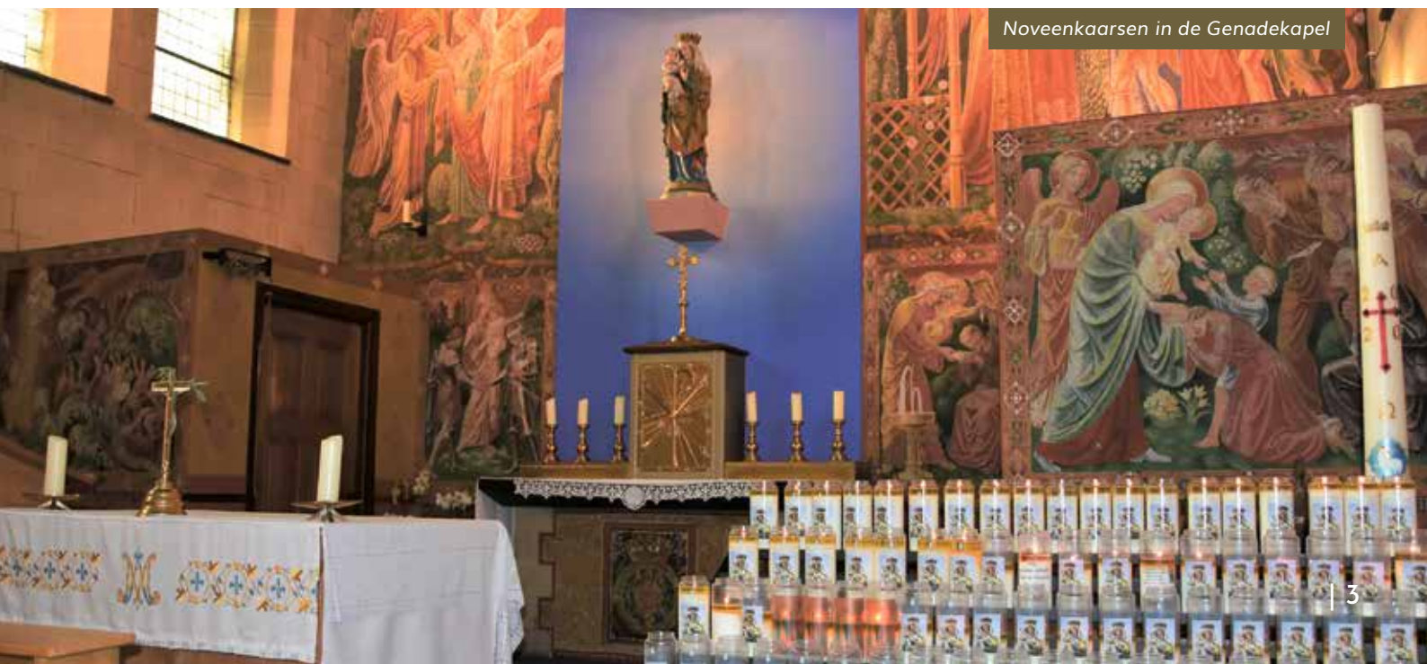
Noveenkaarsen in de Genadekapel