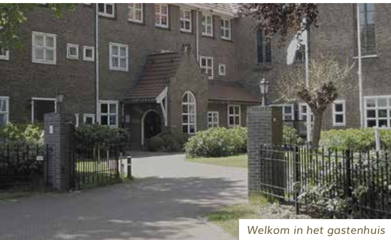
Welkom in het gastenhuis

Rechtsonder: Pauselijk onderscheiden echtpaar Vroni en Henk Kaandorp