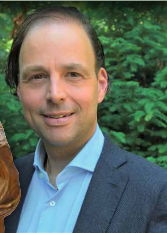
SLAGER IN HET OESDOM