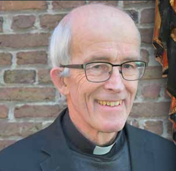
GEROEPEN DOOR DE VREUGDE