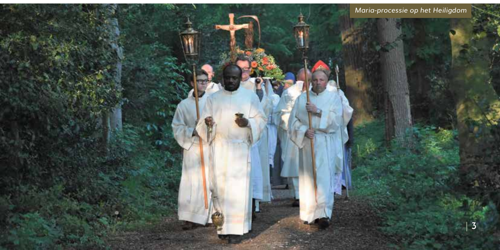
Maria-processie op het Heiligdom

Ik hoop dat u zich ook weer vrij genoeg voelt om op pad te gaan. Dat u ook in de gelegenheid zal zijn, deze zomer, om regelmatig het Heiligdom te bezoeken. Twee zaken wil ik graag bij u aanbevelen: vanaf ongeveer half juli zal de nieuwe Podcasttour op ons Heiligdom beschikbaar zijn. Op tien markante plekken zijn mooi ontworpen bordjes geplaatst met informatie over die plek, met een Bijbelvers en een gedachte ter meditatie. Tevens kunt u op elke plek met uw mobiele telefoon een QR-code scannen en persoonlijke verhalen en informatie beluisteren van mensen die op één of andere manier betrokken zijn bij het Heiligdom. Ik denk dat dit een grote aanwinst voor ons Heiligdom zal zijn, vooral voor nieuwe bezoekers. Ten tweede wil ik u graag wijzen op het Hoogfeest van Maria Tenhemelopneming op 15 augustus. Wij hopen dit weer op een prachtige wijze buiten te vieren. Ik kijk uit naar uw komst!